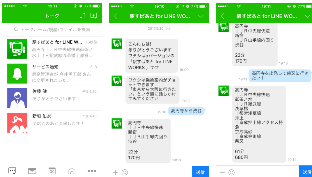
「駅すぱあと for LINE WORKS」α版 画面イメージ

経路検索システム「駅すぱあと」を提供する株式会社ヴァル研究所（本社：東京都杉並区、代表取締役：太田信夫）は2017年6月13日（火）、「LINE」とつながる唯一のビジネスコミュニケーションツール「LINE WORKS」と連携したチャットボット「駅すぱあと for LINE WORKS」のα版をリリースします。「LINE WORKS」に連携する乗り換え案内サービスとしては「駅すぱあと」が初となります。