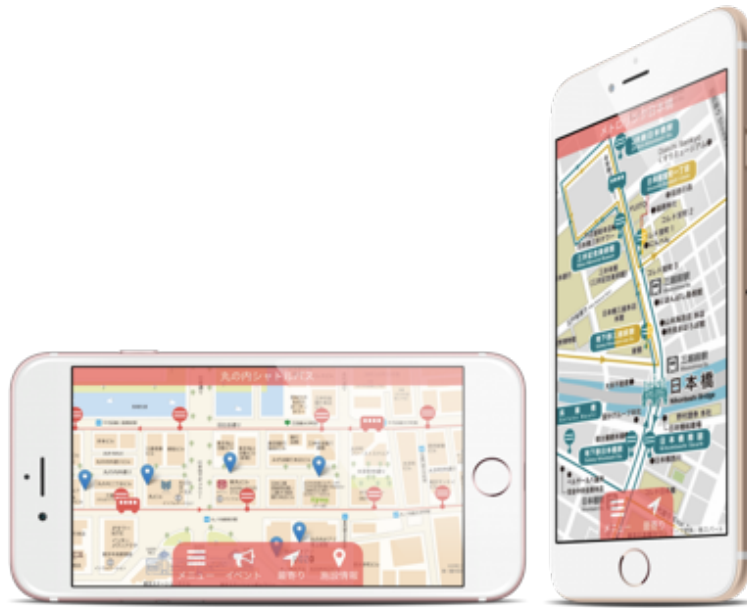
「SkyBrain」導入第1号の日の丸自動車興業株式会社のアプリ「無料巡回バス」のイメージ