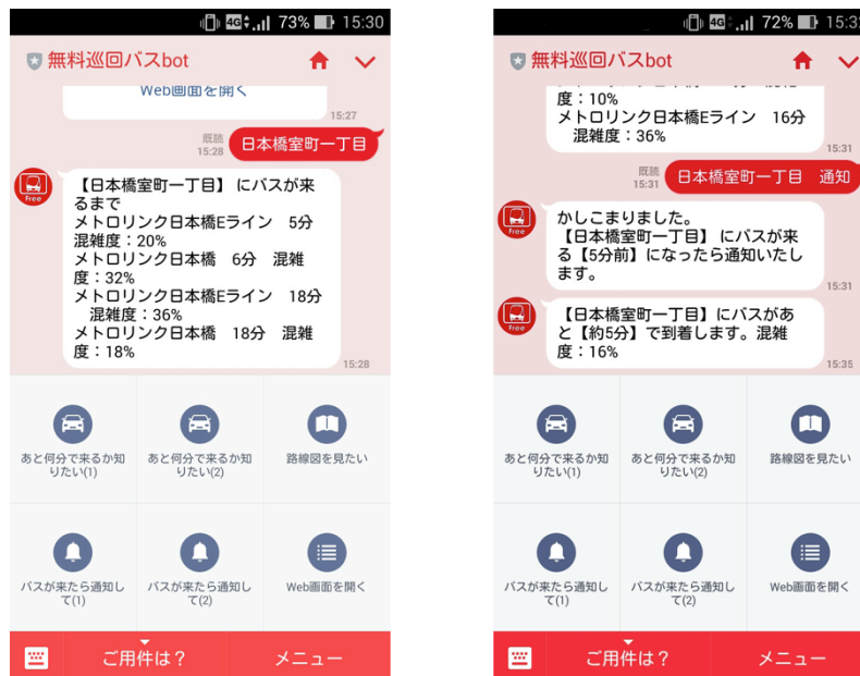
開発中の LINE bot の画面イメージ

「SkyBrain API」を活用した LINE Bot を、今後提供する予定です。利用者が使い慣れたアプリや方法でバスの情報にアクセスできるようにすることで、バスの利便性向上を目指します。