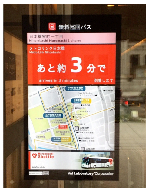
「SkyBrain」を導入した日の丸自動車興業株式会社のデジタルサイネージの事例

バスロケーションサービスとは、無線通信やGPSなどを活用してバスの位置情報を収集し、バス停の表示板やパソコン、スマートフォンなどに情報を配信するバスロケーションシステムを用いたサービスを指します。交通渋滞や悪天候で定時運行ができていない際、バス事業者やバス利用者にリアルタイムでバスの現在位置や到着予定時刻を提供でき、「バスが今どこを走っているのか知りたい」などのニーズに対応します。