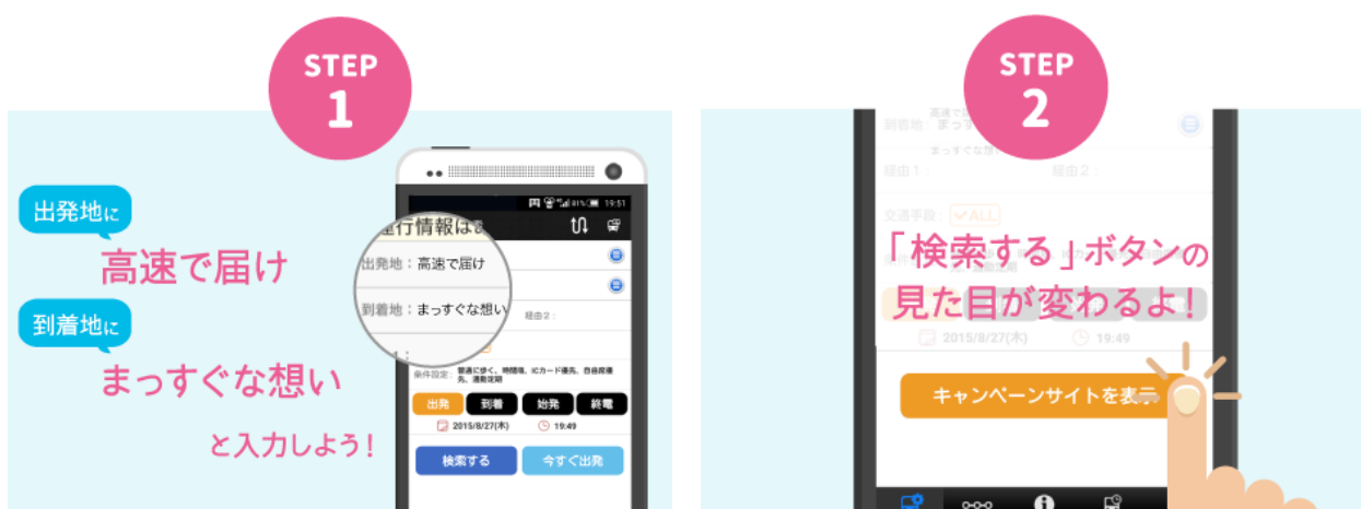
↑ キャンペーンサイトへのアクセス手順

公共交通機関の乗り換え案内アプリ「駅すばあと」で、出発地を「高速で届け」、到着地を「まっすぐな想い」に設定・検索し、キャンペーンサイトへのボタンをタップします。