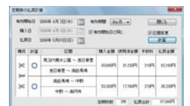
定期券払い戻し計算